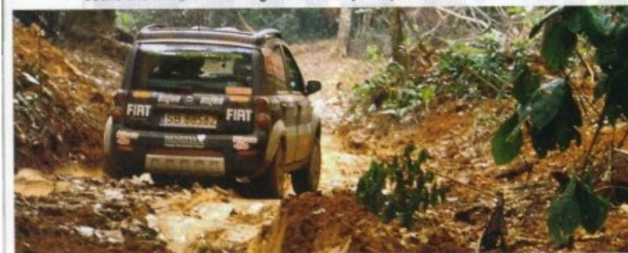
Pokonali 350 km z Gabonu do Konga, by zawrócić, bo dukt kończy się... dżunglą.