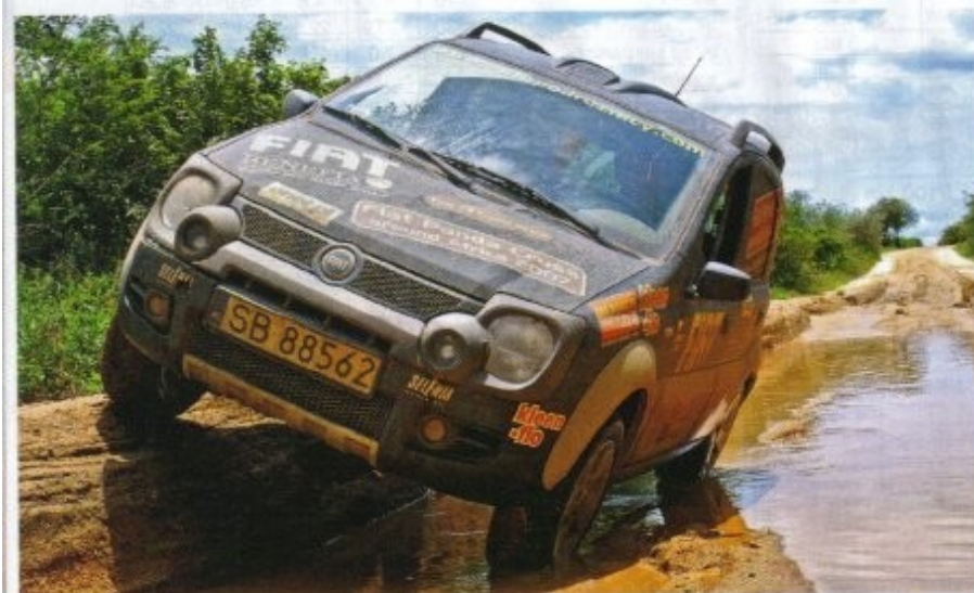
Jedna z takich „kałuź” w Angoli okazała się zabójczą dla rozrusznika Pandy.