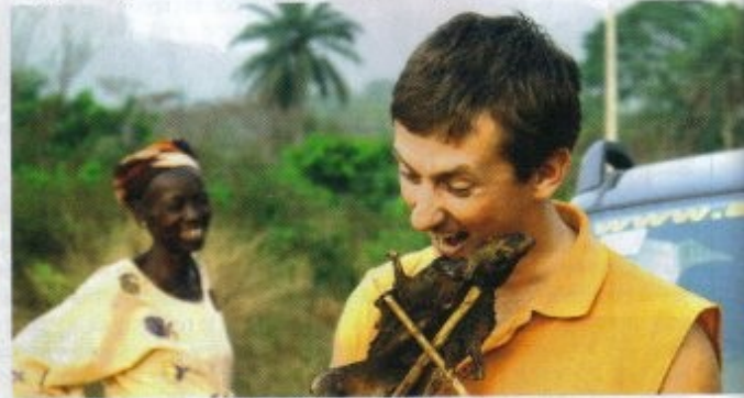
Suszone szczury wodne to przysmak kuchni kameruńskiej.