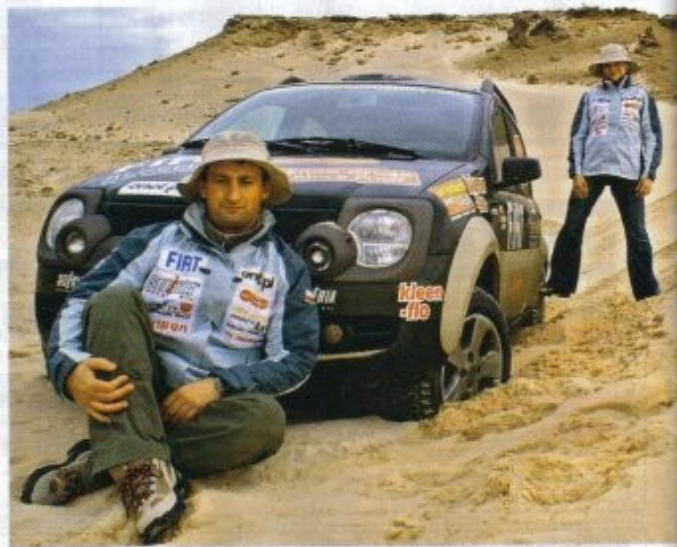
Napęd Pandy 4x4 dobrze się sprawdza, ale wydmy Mauretanii go pokonały.