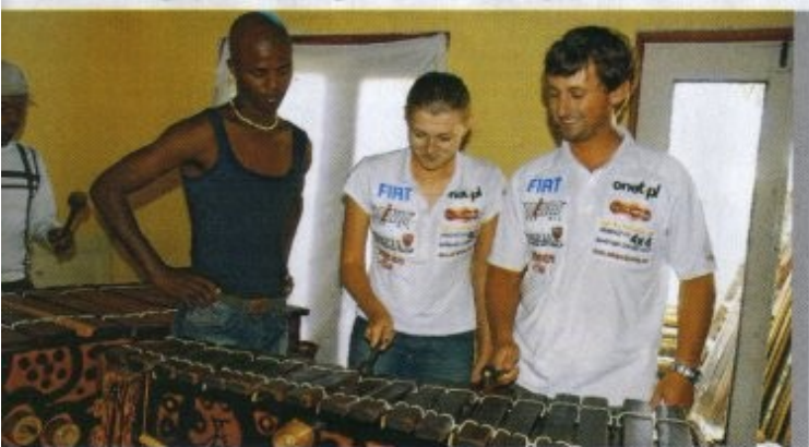
Grać na wibrafonie uczyli się w Township, jednej z biednych dzielnic Kapsztadu.